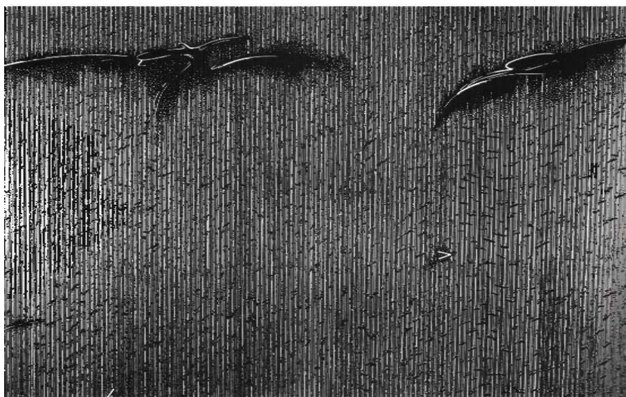
Aki KURODA, (conti/NUIT/é) IV, 1980.

sous la direction de Yann MÉVEL et Tsutomu IMAI