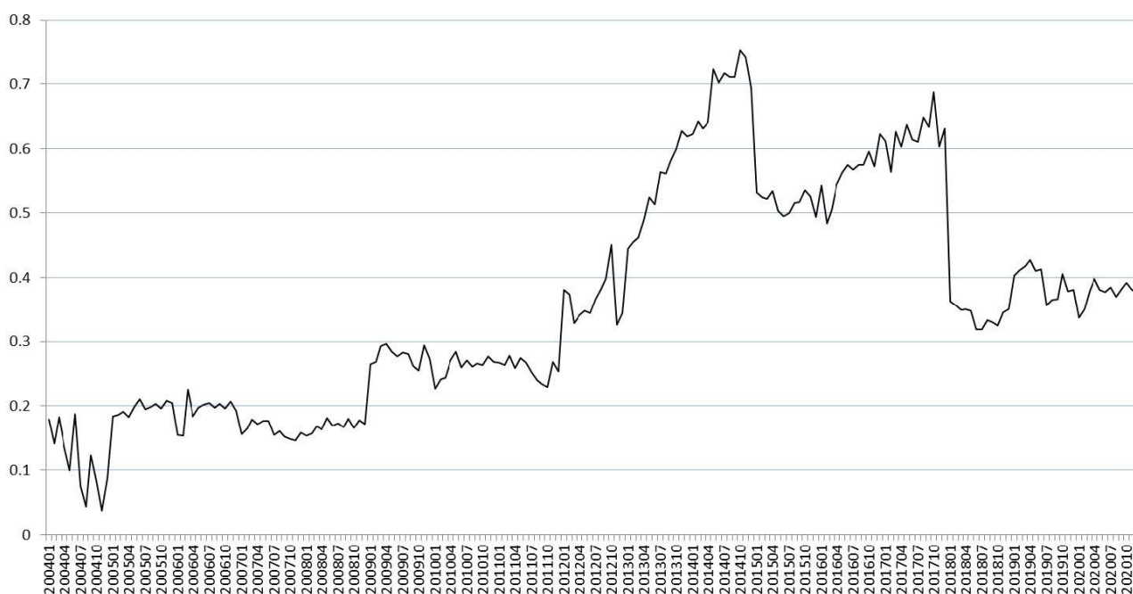
図表 3. 「きまって支給する給与」再集計による増分

「政府統計の総合窓口」(e-Stat) の「毎月勤労統計調査 全国調査」 https://www.e-stat.go.jp/stat-search/files?tstat=000001011791 から、各月の「きまって支給する給与」について下記の a/b の値を示す。 (a) 「長期時系列表」の「実数・指数累積データ」から「実数・指数累積データ 実数」(表番号 1) のファイル (hon-maikin-k-jissu.csv) (b) 「【参考】従来の公表値」の「長期時系列表」の「実数・指数累積データ」から「実数・指数累積データ 実数」(表番号 1) のファイル (juu-maikin-k-jissu.csv)