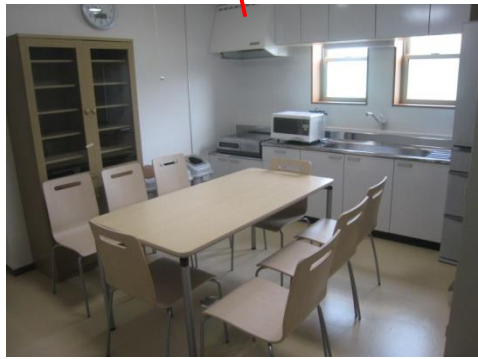
オープンリビング