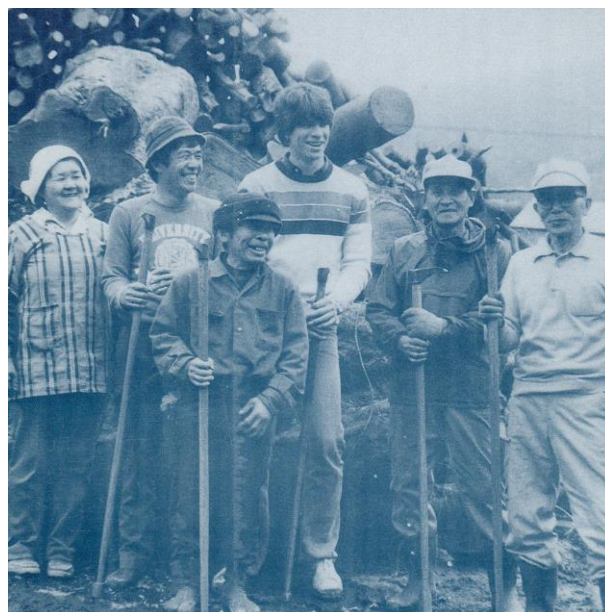
第5回からいも交流(1986年)

「日本人の友達ができない」、「日本らしい文化や背景を知ることができない」、「日本に家族がほしい」という留学生がたくさんいます。37年前、「本当の日本を理解したい!」という留学生の願いから、この交流が鹿児島県の農村で始まりました。今では、鹿児島と宮崎の約60の市や町に広がり、88の国/地域から約4672名の学生が参加して、南九州一般家庭の生活を体験しました。